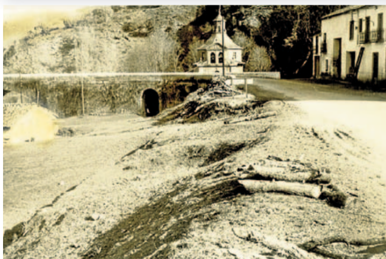
Antigua foto de Villanueva en Cameros. :: A.P.G.

al año siguiente es nombrado diputado provincial sin la más mínima oposición, cargo aceptado para intentar poner remedio a los males generales de la sociedad de su tiempo.