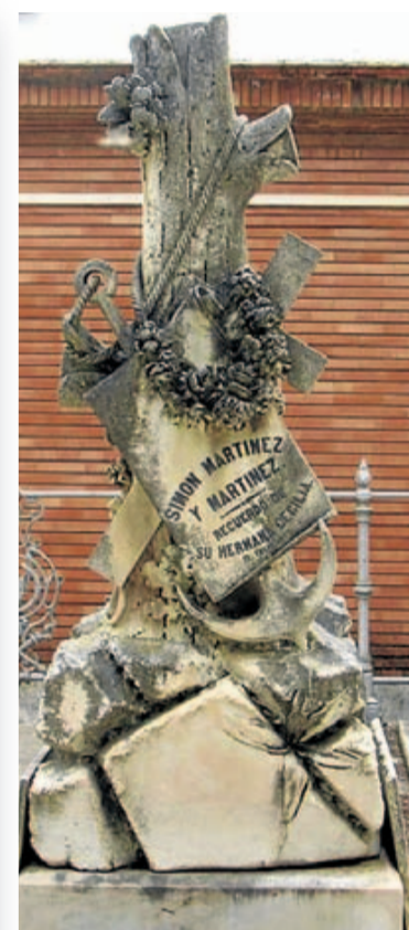
Panteón donde descansa el empresario riojano.

Pero Simón nunca se olvidó de su pueblo. El 'pirino' fue el principal