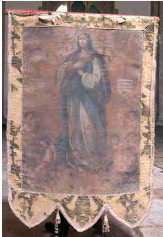
1. Estandarte de Fray Juan de Prado utilizado en las procesiones immaculistas del siglo XVII. Convento de San Francisco. Santiago de Compostela.