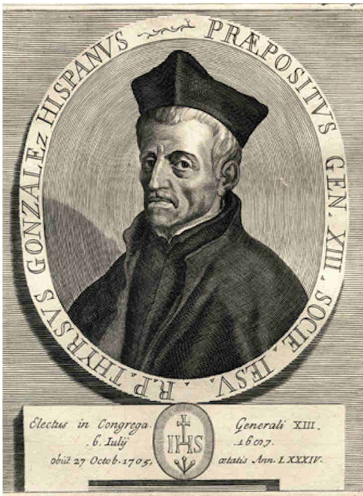
5. Retrato de Tirso González de Santalla, SI. Libro de Elías Reyero "Las misiones de Tirso González..." (Archivo).