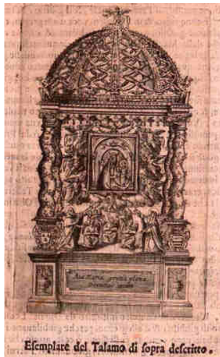
4. Grabado del libro en que figura el talamo o altar de la Virgen del Rosario de esta procesión.