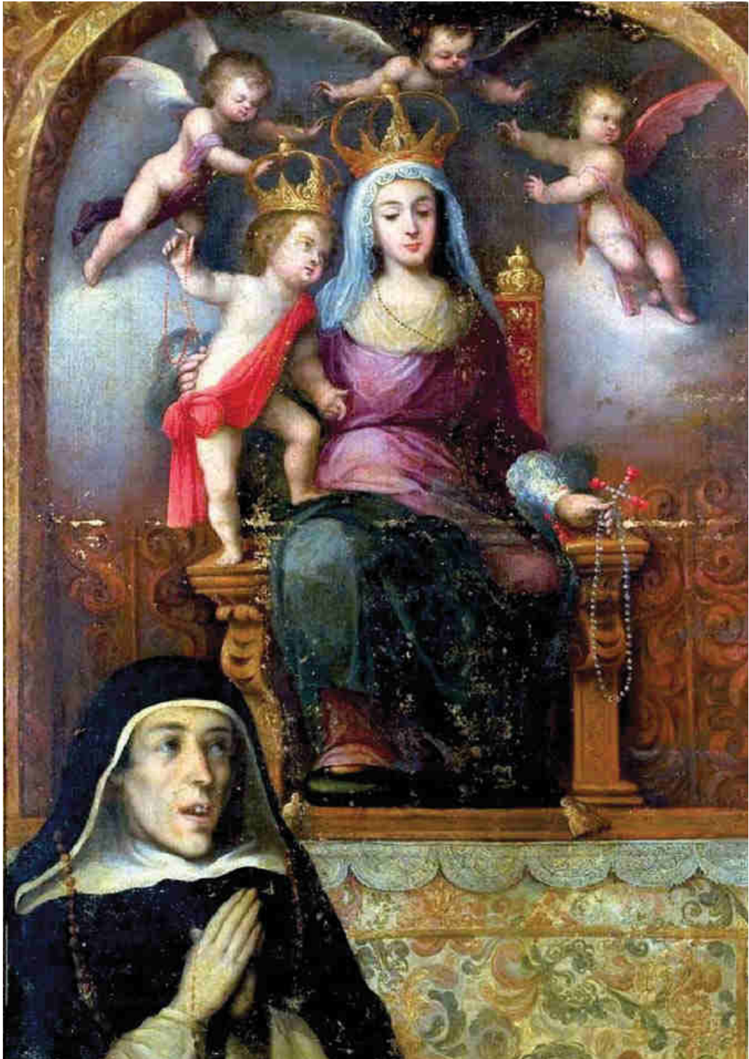
7. Curioso lienzo popular, de comienzos del siglo XVIII, de la Virgen del Rosario del retablo mayor de San Pablo con el padre Ulloa. Col. particular. Cfr. Porres Benavides, J.: "Devociones en el convento de San Pablo de Sevilla (primera parte)". En Miriam , 2011, pp. 143-148. Agradezco al autor su cesión.